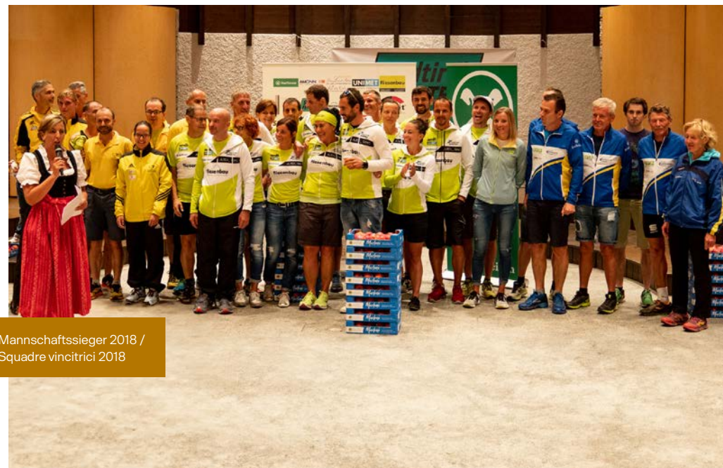
Mannschaftssieger 2018 / Squadre vincitrici 2018