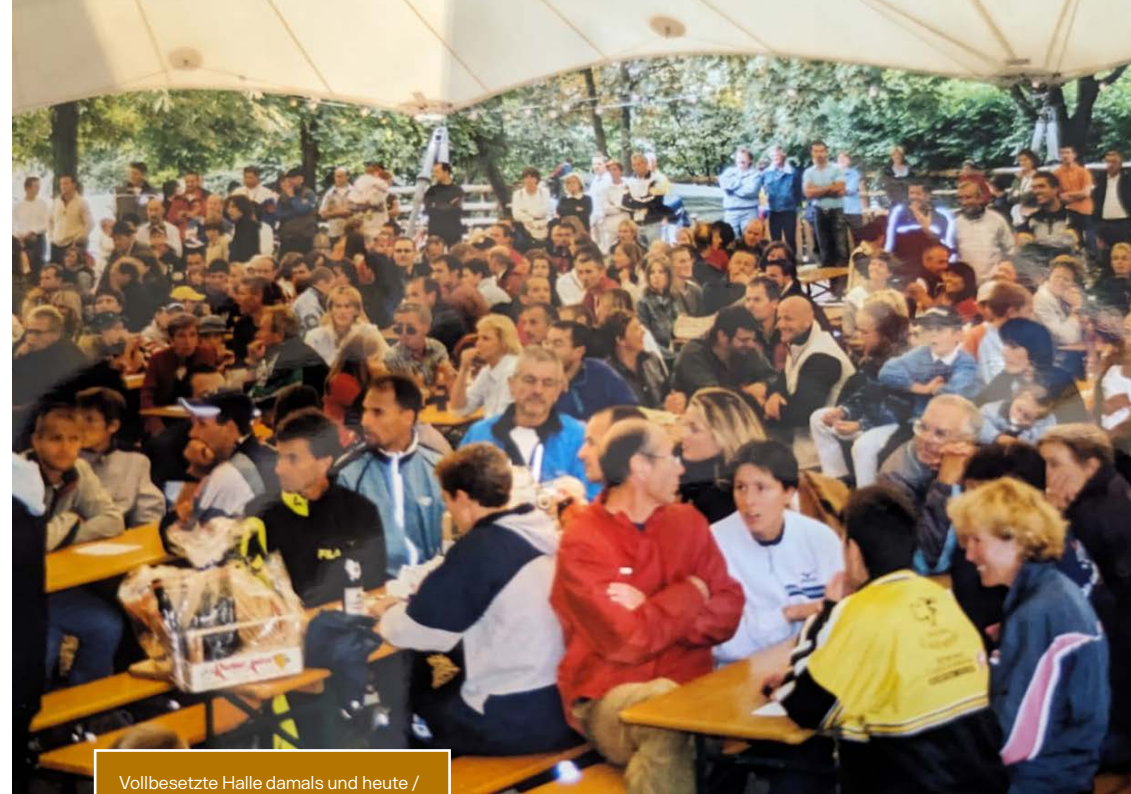
Vollbesetzte Halle damals und heute / Padiglione pieno ieri e oggi